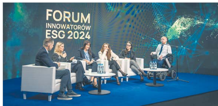
Debata „Zarządzanie różnorodnością, DEI jako wyzwanie i klucz do sukcesu nowoczesnych organizacji”