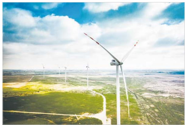
Energa w ramach działań na rzecz zrównoważonego rozwoju inwestuje m.in. w odnawiane źródła energii, co redukuje emisje CO 2

Transformacja biznesu w łańcuchu wartości to nie tylko konieczność, ale także okazja do budowy nowoczesnej, zrównoważonej przyszłości w branży energetycznej. Firmy takie jak Energa poprzez innowacyjne podejście do zarządzania zasobami, transparentność w działaniach oraz bliską współpracę z interesariuszami wpływają na zmiany myślenia strategicznego.