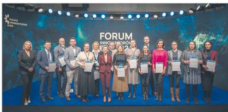
Podczas Forum Innowatorów ESG powołana została grupa robocza ds. transformacji energetycznej