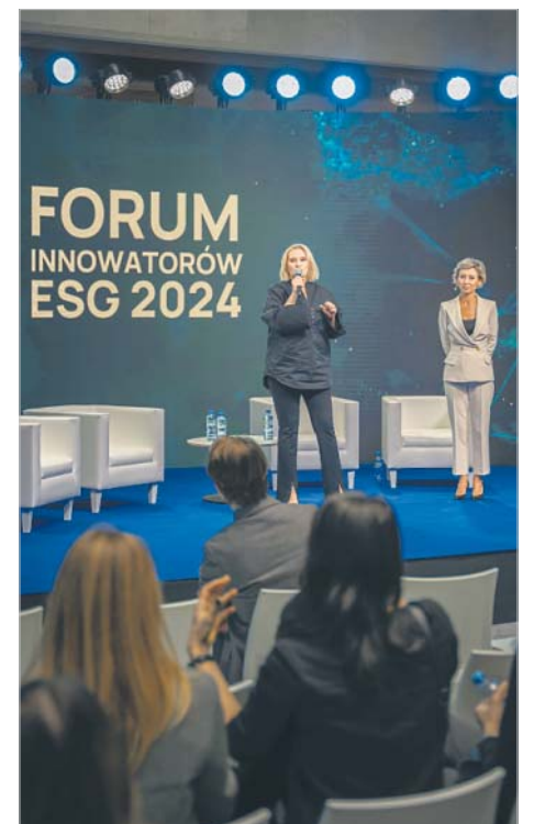
Otwarcie III edycji Forum Innowatorów ESG